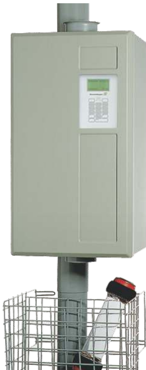
Estación DRT NW110