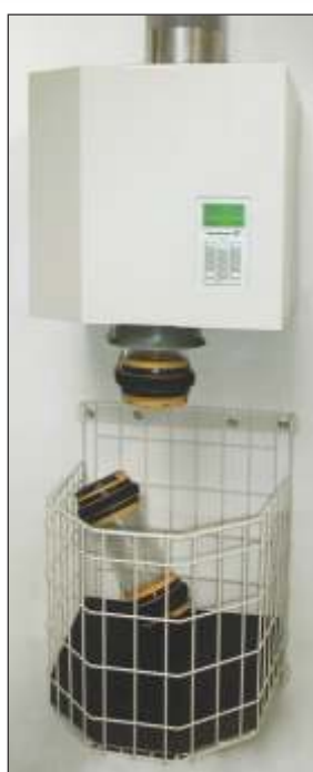
Montaje flexible en la pared