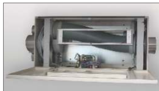
Desviador de tres vías NW160